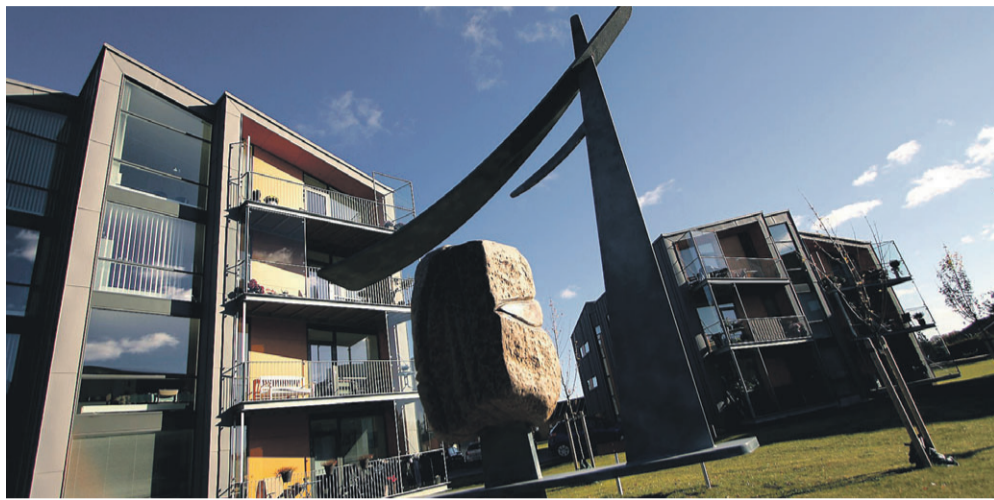
Møhlholm Have er Nordens næstbedste almene boliger.

DRONE En person har fået en bøde på 3.500 kroner for at have overtrådt luftfartsloven gentagne gange med droneflyvning i et villakvarter i Vejle. Man må ikke flyve nærmere end 150 meter fra bymæssig bebyggelse eller offentlig vej. Det oplyser Trafikstyrelsen på sin hjemmeside. Bøden er den hidtil største for ulovlig flyvning med drone.